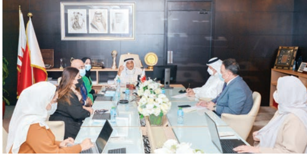
○ رئيس الأعلى للصحة مع ممثلي محافظة المحرق.

عقد رئيس المجلس الأعلى للصحة الفريق طبيب الشيخ محمد بن عبدالله آل خليفة صباح أمس (الإثنين) اجتماعاً بمشاركة كل من العميد عبدالله بن خليفة الجيران نائب محافظ محافظة المحرق والنائب الدكتور هشام العشري عضو مجلس النواب وأعضاء مجلس أمناء مراكز الرعاية الصحية الأولية وعدد من المسؤولين في القطاع الصحي وذلك بشأن قرب التطبيق التجريبي لمشروع التسيير الذاتي لمراكز الرعاية الصحية الأولية في محافظة المحرق.